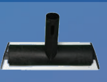
Accessoire surfaces hautes